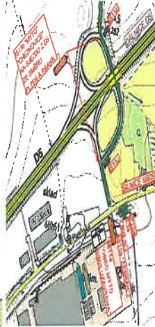
DETAIL KŘIŽOVATKY I/605 x D5 - II. ETAPA